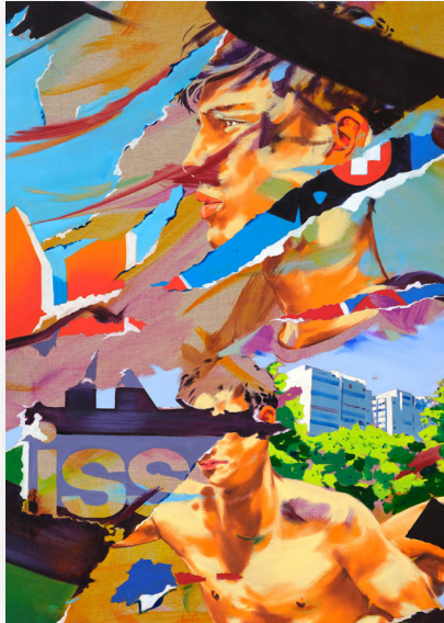
Norbert Bisky, Berliner Allee , 2025, oil on canvas, 150 x 120 cm (59 x 47 1/4 in) (NBI 020). © the artist

Esther Schipper freut sich, Polympsest , Norbert Biskys erste Einzelausstellung mit der Galerie, anzukündigen. Gezeigt werden neue Gemälde und zwei Lampenskulpturen.